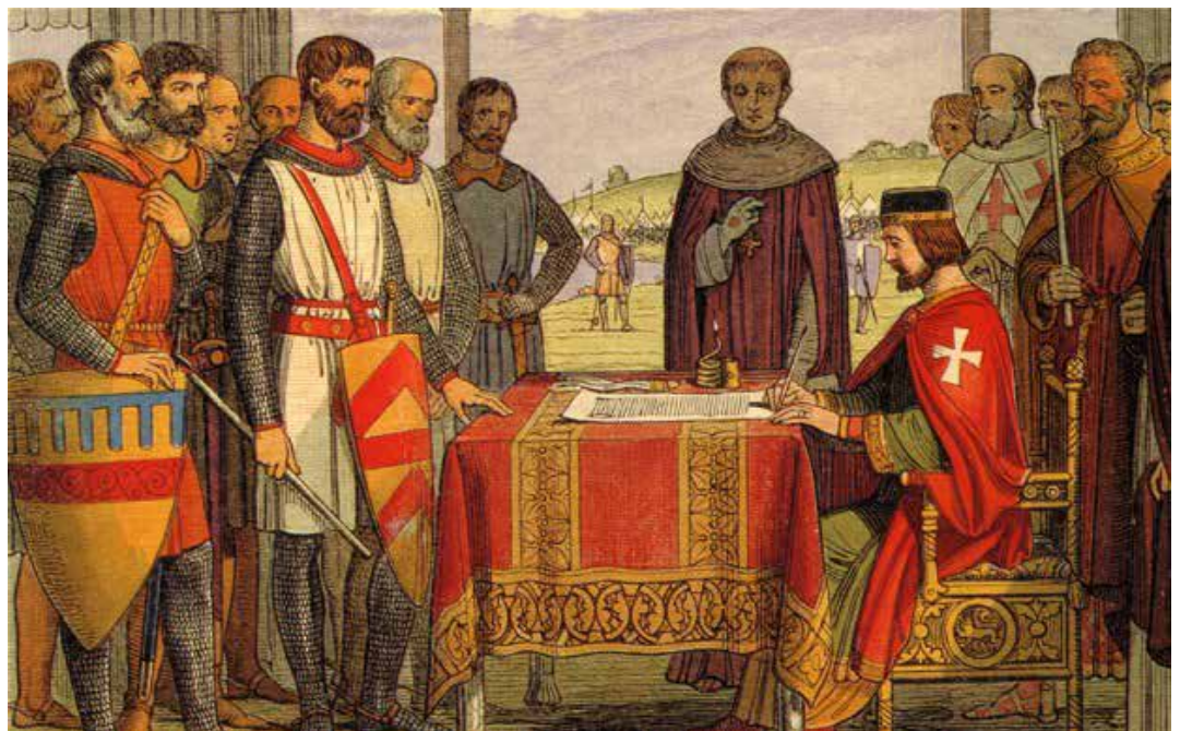
Le roi Jean Sans-Terre signe la Magna Carta à Runnymede en juin 1215.

Nous allons distribuer aux participants intéressés le texte de M. Rioux et l'on fera les liens voulus avec les revendications des Patriotes de 1837-1938.