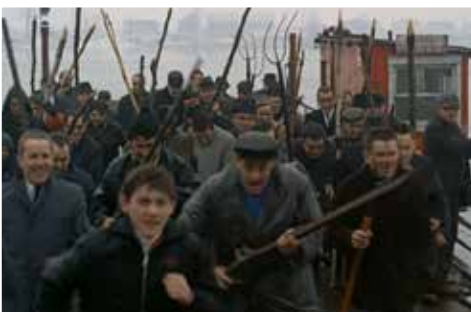
Les nombreux Patriotes arrivant de Saint-Antoine et des environs.