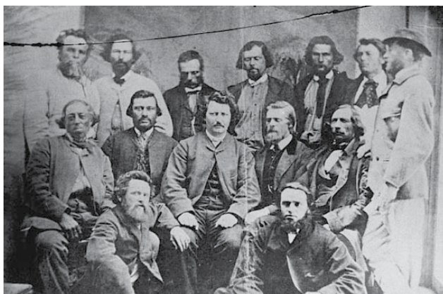
Le gouvernement provisoire métis (Riel au centre et Lépine en haut, 3 e à partir de la droite).

Par malheur, la plupart des Québécois n'apprennent plus leur histoire. Et, de leur côté, les Métis ayant été majoritairement anglicisés, les liens entre EUX et NOUS se sont distendus.