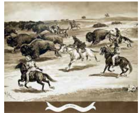
La chasse au bison au 19 e siècle au pays de Louis Riel.

des immigrants amenés d'Angleterre, le statut bilingue de la province disparut en 1890. Les Métis furent forcés de se disperser partout dans l'Ouest parce que leurs titres ne furent pas honorés. Le bilinguisme ne revint que 120 ans plus tard. Trop tard pour bien des francophones.