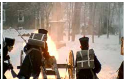
Les troupes anglaises au combat dans le parc.