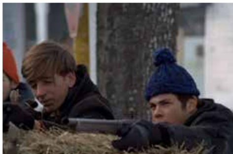
Deux Patriotes à l'affût.