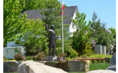
Mémorial Louis-Joseph Papineau.

Aussi les Pavillons historiques à la Place du Bourg en l'an 2000; le Centre médical devenu Coopérative de santé; le 200 e de l'église en 1996 et la reconnaissance de la « Cloche de la Liberté »